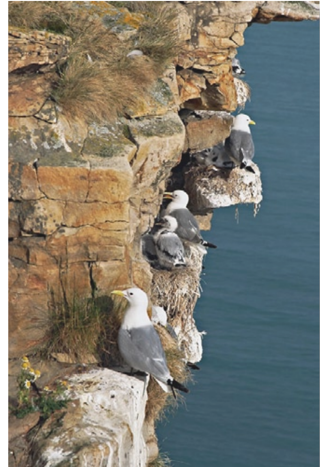
FOTOGRAF BO DAVIDSSON

Bo Davidsson Klostergatan 24 442 36 Kungälv tel: 0303-153 44 070-604 04 23 e-post: bo@boprod.se